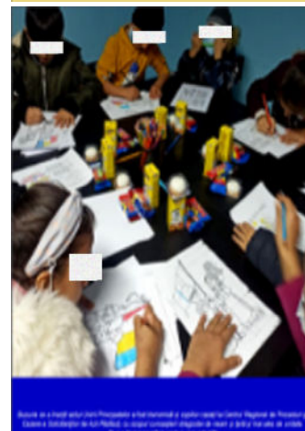
Doă imagini care reflectă viziunea naționalistă de integrare aplicată de IGI copiilor din Centrul Regional Rădăuți

cont propriu spre alte destinații. Tot aici, cei de la IGI împreună cu ONG-uri locale religioase, solicită sume exorbitante de bani de la Uniunea Europeană, pentru a demara diferite proiecte de asimilare etnică și culturală. Un bun exemplu în acest sens este newsletter-ul editat de IGI, unde în fiecare număr sunt afișate numeroasele politici de asimilare etnică albă și naționalistă, prin activități care celebrează personaje și evenimente istorice din România, minori desenând simboluri naționale, dar și activitățile extracurriculare ale angajaților poliției, precum propriile campionate de pescuit. Aplicarea frecventă de corecții corporale și rasismul acestor spații temporare au fost raportate în numeroase rânduri. Victimele acestui sistem concentrațional au relatat că: „condițiile de aici sunt foarte rele! Foarte, foarte rele. Cei de la pază, toți care lucrează aici, sunt atât de rasiști! Vorbesc cu noi de parcă nu am fi refugiați aici. Suntem animale, suntem... nu știu... Sunt atât de rasiști!” 12 Fiind gestionate de instituții patriarhale și de cele mai multe ori