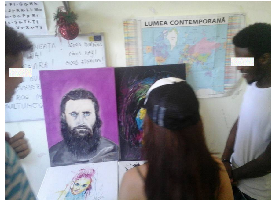
Un grup de tineri desenând portretul lui Arsenie Boca, participanți la un program susținut la AIDrom

culturale și a depolitizării conflictelor armate. Astfel, printre numeroasele programe de mușamalizare a situației în care se află persoanele refugiate (în engleză: whitewashing ), copii și adulții sunt expuși, în numele unui „multiculturalism” neo-liberal, la practici de asimilare etnică, religioasă și culturală albă. Alte programe AIDrom, precum Timișoara Refugee Art Festival, organizat împreună cu UNHCR, au expus persoanele participante la atacuri din partea extremiștilor de dreapta. În sala de conferințe, de exemplu, au fost strecurate înregistrări ale unor imnuri legionare, dar și sunete care simulau bombardamente. 15