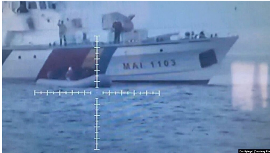
Nava poliției MAI 1103

acțiuni ilegale de împiedicare a refugiaților să ajungă din Turcia pe malul grecesc al Mării Egee. Mai exact, la mijlocul anului 2020, o navă identificată cu MAI 1103, aparținând Poliției de Frontieră române a fost surprinsă într-o înregistrare video producând valuri în apropierea unei bărci de cauciuc a migranților cu scopul de a le bloca accesul spre țărm și având posibil intenția de a scufunda mica ambarcațiune. 8