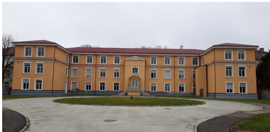
Centrul de Tranzit Timișoara

aceasta fiind aplicat de către jandarmerie, așa cum s-a întâmplat cu refugiații care au ocupat cladirile abandonate din Timișoara.