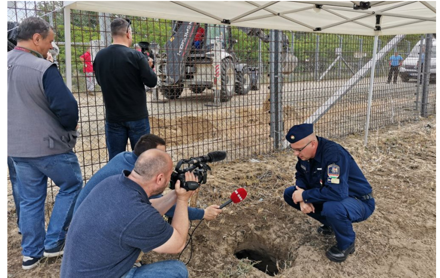
Mass-media împreună cu poliția de frontieră maghiară

Cu toate acestea, au existat numeroase cazuri de discriminare rasială a refugiaților care veneau tocmai din Ucraina (în mare majoritate studenți de culoare care încercau să se întoarcă în țările lor) și să traverseze granițele UE. Dacă în România cazurile acestea nu par să fi fost la fel de numeroase ca în Polonia, au fost raportate (și încă sunt) destule exemple de discriminare împotriva refugiaților romi din Ucraina. 7