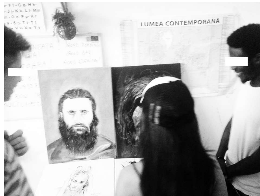
Un grup de tineri desenând portretul lui Arsenie Boca, participanți la un program susținut la AIDrom

culturale și a depolitizării conflictelor armate. Astfel, printre numeroasele programe de mușamalizare a situației în care se află persoanele refugiate (în engleză: whitewashing ), copii și adulții sunt expuși, în numele unui „multiculturalism” neo-liberal, la practici de asimilare etnică, religioasă și culturală albă. Alte programe AIDrom, precum Timișoara Refugee Art Festival, organizat împreună cu UNHCR, au expus persoanele participante la atacuri din partea extremiștilor de dreapta. În sala de conferințe, de exemplu, au fost strecurate înregistrări ale unor imnuri legionare, dar și sunete care simulau bombardamente. 15