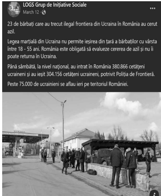
Postare LOGS prin care se atrage atenția că persoanele care ar trebui să lupte în război trec ilegal frontiera.

recent printr-o postare pe pagina de socializare un număr de 23 de persoane din Ucraina ca fiind dezertoare de război, deci susceptibile deportării sub legea marțială. Devenită și o afacere de familie, asociația rulează proiecte pe bani europeni pentru a oferi tichete de masă, broșuri informative cu privire la procesul de azil, produse de igienă, posibilitatea de a oferi dușuri etc. La fel ca Asociația Serviciul Iezuiților pentru Refugiați din România (JRS), LOGS este una din multele organizații bisericești care își propun „salvarea” celor care ajung pe țărmurile Europei creștine.