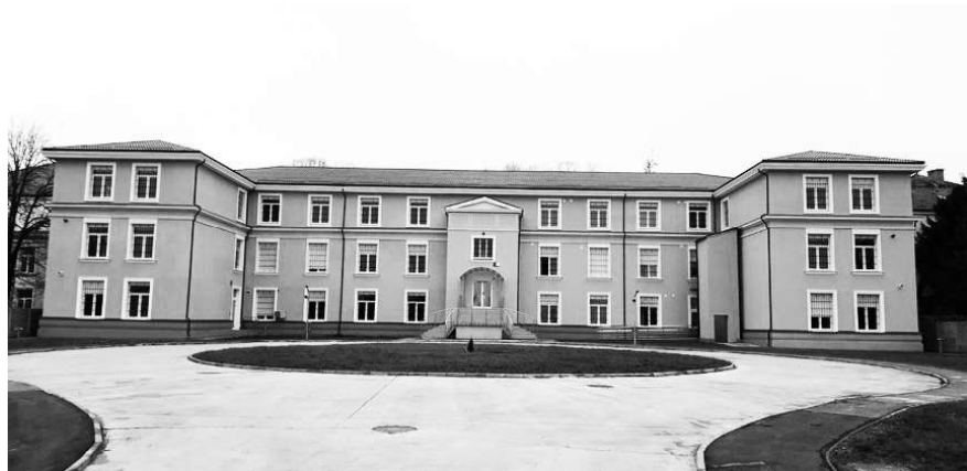
Centrul de Tranzit Timișoara

aceasta fiind aplicat de către jandarmerie, așa cum s-a întâmplat cu refugiații care au ocupat cladirile abandonate din Timișoara.