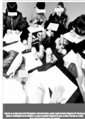
Două imagini care reflectă viziunea naționalistă de integrare aplicată de IGI copiilor din Centrul Regional Rădăuți

cont propriu spre alte destinații. Tot aici, cei de la IGI împreună cu ONG-uri locale religioase, solicită sume exorbitante de bani de la Uniunea Europeană, pentru a demara diferite proiecte de asimilare etnică și culturală. Un bun exemplu în acest sens este newsletter-ul editat de IGI, unde în fiecare număr sunt afișate numeroase politici de asimilare etnică albă și naționalistă, prin activități care celebrează personaje și evenimente istorice din România, minori desenând simboluri naționale, dar și activitățile extracurriculare ale angajaților poliției, precum propriile campionate de pescuit. Aplicarea frecventă de corecții corporale și rasismul acestor spații temporare au fost raportate în numeroase rânduri. Victimele acestui sistem concentrațional au relatat că: „condițiile de aici sunt foarte rele! Foarte, foarte rele. Cei de la pază, toți care lucrează aici, sunt atât de rasiști! Vorbesc cu noi de parcă nu am fi refugiați aici. Suntem animale, suntem... nu știu... Sunt atât de rasiști!” 12 Fiind gestionate de instituții patriarhale și de cele mai multe ori prea insalubre pentru a putea fi locuite, aceste spații carcerale continuă să genereze violență și homofobie: „Când am ajuns aici (n.r. - în centru), poliștii m-au întrebat, cu zâmbetul pe buze, dacă îmi plac băieții. Le-am spus că da, așa e, sunt gay. Nu știu cum să spun, felul în care m-au întrebat și s-au uitat la mine a fost unul care m-a făcut să nu mă simt deloc confortabil.” 13