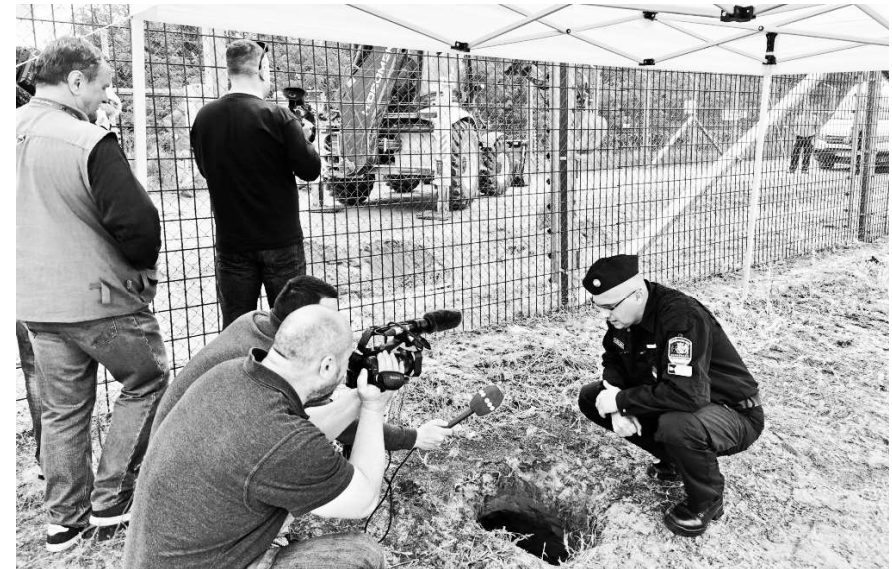
Mass-media împreună cu poliția de frontieră maghiară

se declară ca fiind „o organizație grass-roots din vestul României”, împrumutând astfel denumirea de la mișcările politice comunitare auto-organizate care luptă pentru justiție socială. În practică, asociația continuă aceleași politici filantropice religioase și de asimilare albă începute de AIDrom, monopolizând astfel în continuare orice manifestare de solidarizare cu persoanele aflate în tranzit. Spre exemplu, LOGS, împreună cu trusturi mass-media, au expus