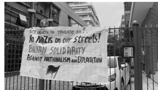
Acțiune de protest împotriva marșului neonazist Lukov în fața Consulatului Bulgariei din Salonic/Grecia, în februarie 2023.