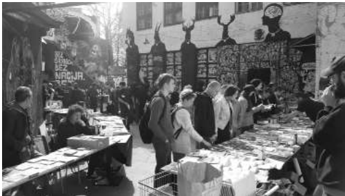
Participanți și standuri de carte la Târgul Anarhist de Carte din Balcani 2017, care a avut loc la Centrul Cultural Autonom Medika din Zagreb.