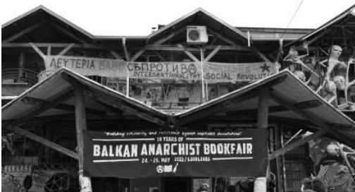
Bannere la Târgul Anarhist de Carte din Balcani din 2013 de la Ljubljana/Slovenia.