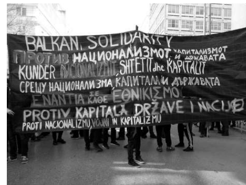
Bannerul frontal al blocului balcanic de la marșul de solidaritate anti-națională din 2018 din Salonic/Grecia.

Afiș împotriva naționalismului tipărit în limbile greacă, macedoneană, albaneză și bulgară la începutul anului 2018, în semn de protest față de escaladarea disputei greco-macedoniene privind numele statului macedonean, cu puțin timp înainte ca squat-ul Libertatia din Salonic/Grecia să fie atacat și incendiat de fasciștii greci.