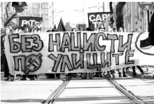
Bannerul care deschidea marșul anti-fascist anti-Lukov din 2018 de la Sofia/Bulgaria, pe care scrie: „Fără naziști pe străzile noastre!”