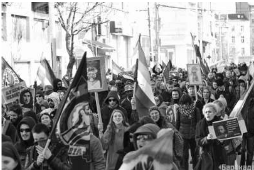
Blocul queer de la marșul antifascist anti-Lukov din 2018, Sofia/Bulgaria.

Deși câteva mii de exemplare ale ziarului nu puteau face mare lucru, apariția sa a fost o palmă pentru cenzorii locali și pentru naționaliști. Publicația a reprezentat o voce puternică de solidaritate între oamenii care trăiau de ambele părți ale liniei frontului și care nu susțineau războiul sau puterea politică a vreunei părți.