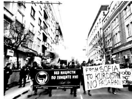
Marșul antifascist împotriva manifestației neonaziste Lukov din Sofia/Bulgaria, în februarie 2023. Comitetele de organizare al Târgului Anarhist de Carte din Balcani 2023 din Slovenia a călătorit la Sofia și s-a alăturat marșului.