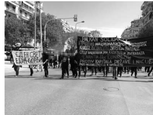
Blocul balcanic la marșul de solidaritate anti-națională din 2018 în solidaritate cu squat-ul Libertatia , incendiat la Salonic/Grecia.

ΕΝΑΝΤΙΑ ΣΕ ΕΘΝΙΚΙΣΜΟ ΚΑΙ ΚΑΠΙΤΑΛΙΣΜΟ Βαλκανικός συντονισμός, αντίσταση, αλληλεγγύη, διεθνισμός ПРОТИВ НАЦИОНАЛИЗМОТ И КАПИТАЛИЗМОТ Балканска координација, отпор, солидарност, интернационализам KUNDER NACIONALIZMIT DHE KAPITALIZMIT Koordinim ballkanik, rezistencë, solidaritet, internacionalizëm СРЕЩУ НАЦИОНАЛИЗМА И КАПИТАЛИЗМА Балканска координација, съпротива, солидарност, интернационализъм Διεθνιστές από τα Βαλκάνια / Интернационалисти од Балканот Интернационалисти от Балканито / Интернационалисти nga Ballkani