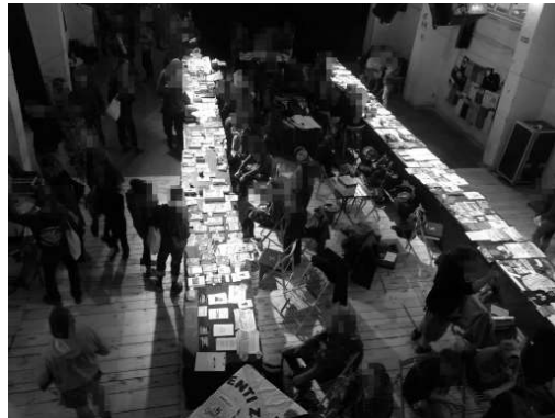
Standuri de carte la Târgul Anarhist de Carte din Balcani 2018, organizat la Novi Sad/Serbia.