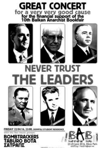
Afișul unui concert pentru susținerea financiară a Târgului Anarhist de Carte din Balcani din 2016, de la Ioannina/Grecia.