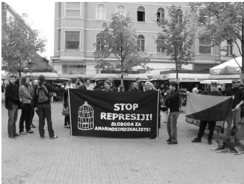
La 14 septembrie 2009, organizația anarho-sindicalistă croată MASA a organizat un protest la Zagreb/Croația, manifestându-și solidaritatea cu „cei șase” din Belgrad.

Una a fost cea de a înființa o Federație Anarhistă a Iugoslaviei, venind din Slovenia. Cealaltă a fost de a crea o organizație anarho-sindicalistă comună care să se alăture AIT, iar apoi să creeze un subsecretariat pentru Balcani. În cele din urmă, fiecare propunere a fost într-un fel realizată prin intermediul organizațiilor locale. 13