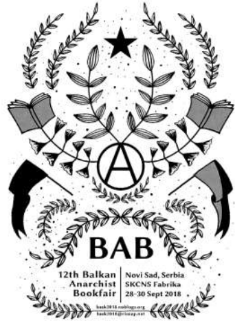
Νόβισαντ. Afiș pentru Târgul Anarhist de Carte din Balcani din 2018, organizat la Novi Sad/Serbia.