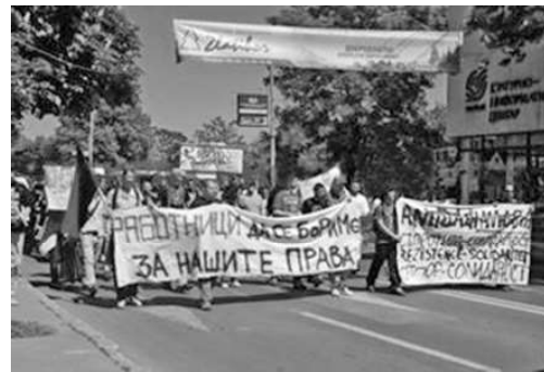
Σκόπια. Imagini de la mitingul cu ocazia zilei de 1 mai 2010, organizat în comun la Skopje/Macedonia de anarhiști macedoneni, bulgari albanezi și greci.