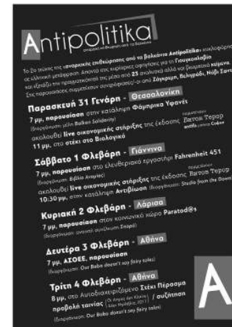
Afiș pentru turneul revistei anarhiste balcanice Antipolitika în diferite orașe din Grecia.