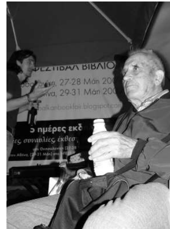
Alexander Nakov își prezintă autobiografia la Târgul Anarhist de Carte din Balcani de la Salonic, din 2009. Nakov, un veteran al mișcării anarhiste bulgare, în vârstă de 90 de ani la momentul târgului de carte, a petrecut 12 ani în închisorile țării, în gulagurile comuniste și în exilul intern.