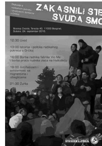
Afișul Forumului Social organizat de grupul anarhist Burevesnik din Belgrad în 2016 despre luptele sociale din Grecia. Printre temele abordate se numără fabrica VIO. ME ocupată și condusă de muncitori, lupta împotriva exploataării de aur din Halkidiki, antifascismul și solidaritatea cu migrații.