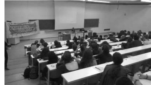
Imagini de la o discuție care a avut loc în cadrul Întâlnirii Anarhiste Balcanice din 2015 de la Salonic/Grecia.

[În jurul anului 1994] au început două proiecte noi, buletinul informativ Necemo i nedamo (Nu vrem și nu dăm) și versiunea sa în limba engleză, Zaginflatch (Zagreb Information Potlach). În următorii 7 sau 8 ani, aceste două buletine au reprezentat surse importante de informații, apărând o dată la câteva luni, în funcție de bani și de alte resurse. Tirajul era de la câteva sute la câteva mii de exemplare. Ideea principală era de a continua linia de gândire a revistei Dincolo de zidurile naționalismului și războiului, dar într-un mod mai informativ. În 1999, în timpul bombardamentelor NATO asupra Serbiei, Zaginflatch s-a dovedit a fi foarte important (cu mult ajutor din partea e-mailurilor și a tehnologiei furnizate de ZaMir). Deoarece Serbia era sub sancțiuni de ani de zile, iar acum și sub atacul direct al bombelor NATO, toate comunicațiile au fost întrerupte și jurnaliștii străini au trebuit să părăsească țara. Singura noastră legătură cu anarhiștii de acolo a fost ex-yu-a-lista (găzduită de ZaMir), o listă de e-mail/un forum informativ pentru anarhiștii din fosta Iugoslavie. Oamenii trimiteau știri, povești, texte și