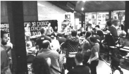
Discuție în timpul Festivalului Antifascist Zrenjanin/Serbia (ZAF) 2012.

Afișul evenimentului de strângere de fonduri pentru ajutorarea victimelor cutremurului din 2010 de la Kraljevo/Serbia, organizat de grupuri locale de anarhiști din Timișoara/România. Pe scenă au cântat împreună trupe hardcore și punk sârbești și românești.