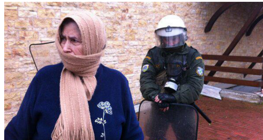
Poliție și localnici în Skouries

Eldorado a cumpărat drepturile de a exploata minier zona și localnicii și-au reluat protestele. În octombrie 2012, poliția a răspuns unui grup de 2.500 de protestatari cu bătăi și gaze lacrimogene. Au fost făcute paisprezece arestări (left.gr, 2012), unul din cei arestați fiind un băiat de 15 ani (left.gr, 2013). Câteva luni mai târziu, în februarie 2013, 40 de persoane mascate au incendiat utilajele de minierit, după ce imobilizaseră paznicii. Poliția a reținut 27 de persoane, dar nu a fost găsită împotriva lor nicio probă (To Vima, 2013). Incendierea le-a dat forțelor de ordine pretextul de care aveau nevoie pentru a teroriza localnicii, reținând persoane la întâmplare și chiar forțând colectarea de probe ADN, în ciuda faptului că celor reținuți nu li se putea aduce nicio acuzație (radiobubble.gr, 2013a). Campania de intimidare a culminat în martie 2013, când șase brigăzi de mascați au luat cu asalt satul vecin, Ierissos (Libcom.org, 2013). Poliția a reținut 7 persoane suspectate de a fi atacat facilitățile de minierit și, după cum au relatat și localnicii, au făcut mai multe percheziții la domiciliu. 22 Potrivit localnicilor, poliția a folosit în mod excesiv gaze lacrimogene (acuză pe care autoritățile au negat-o). În același timp presa nu a acoperit evenimentele din Skouries în mod imparțial, favorizând punctul de