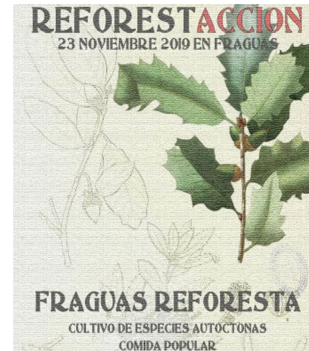
Afiș al colectivului din Fraguas

au urmat au păstrat această categorie. Mai multe mișcări pentru protecția mediului din Italia, Marea Britanie și Franța (cazuri detaliate mai încolo în text) au fost evidențiate ca fiind periculoase. În 2011, Routledge Handbook of Terrorism Research a publicat un „dosar al organizațiilor extremiste și teroriste din lume”, cu liste de grupări „teroriste” din fiecare țară. Este interesant să ne uităm la unele din țările europene. Austria are o singură intrare („Militant Forces against Huntingdon