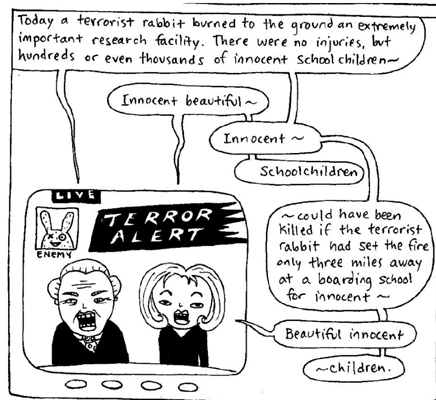
Ilustrație de Stephanie McMillan

29. O traducere în română a acestui text se găsește pe pagina Anarhiva: https://www.anarhiva.com/items/show/475