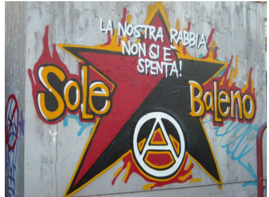
Graffiti în memoria lui Sole și Baleno

Pe parcursul anului 2014, poliția a continuat represiunea violentă împotriva protestatarilor pașnici. Pe 19 februarie, un grup de femei au format un lanț uman pentru a opri ca autobuzele muncitorilor să ajungă la mine. Jandarmii au arestat mai multe protestatari, în timp ce altele au fost internate în spital din cauza rănilor și a expunerii la gazele lacrimogene folosite în exces (Alloush, 2014). De asemenea, localnicii acuzați că ar fi format o organizație teroristă și forțați să ofere probe genetice au fost chemați să se prezinte în fața poliției și a procurorilor aproape zilnic. Așa cum a reieșit din cazul unei persoane urmărite în justiție, procesul de colectare a probelor ADN era complet arbitrar. Materialul său genetic a fost identificat de pe mucusul unei țigări găsite pe munte. În plus, conform legislației grecești, persoana acuzată ar fi trebuit să fie anunțată în privința prelevării de probe ADN pentru identificare, pentru ca aceasta să aibe posibilitatea de a acționa în justiție (Poulimeni, 2014). Represiunea brutală a poliției și procesul arbitrar de obținere a probelor ADN sunt indicații clare că drepturile localnicilor implicați au fost grav încălcate.