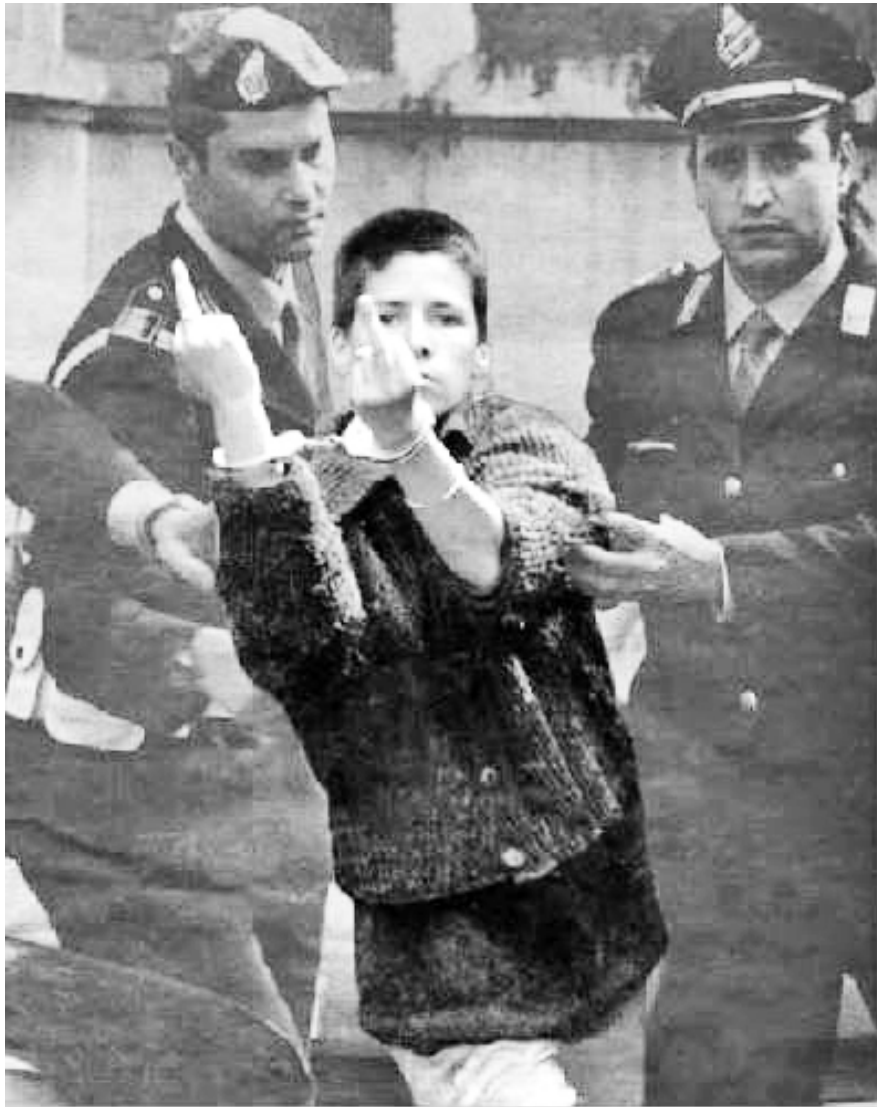
Sole la înmormântarea lui Baleno