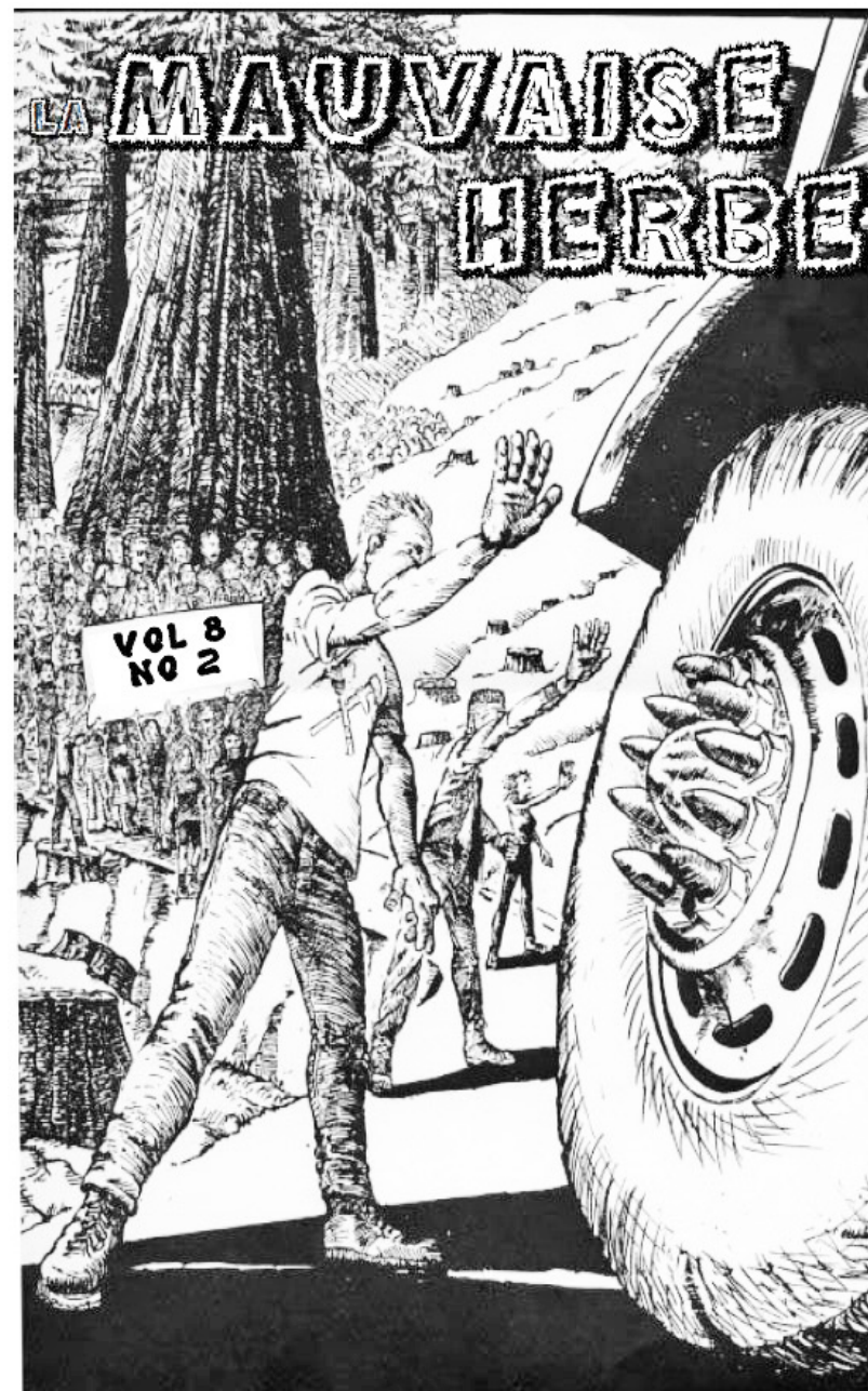
Revista anarho-ecologistă La Mauvaise Herb

Acțiunile și discursurile statului român fac desigur parte dintr-un context mai larg. La nivel european, activismul de mediu a fost din ce în ce mai desemnat drept o amenințare la adresa siguranței și incriminat ca atare. În 2011, una din instituțiile care coordonează activitățile anti-teroriste la nivel european, Europol, a publicat raportul TESAT ( EU Terrorism Situation and