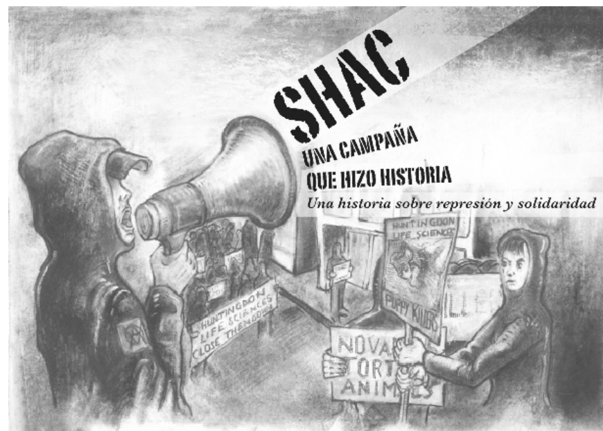
Afiș al campaniei SHAC