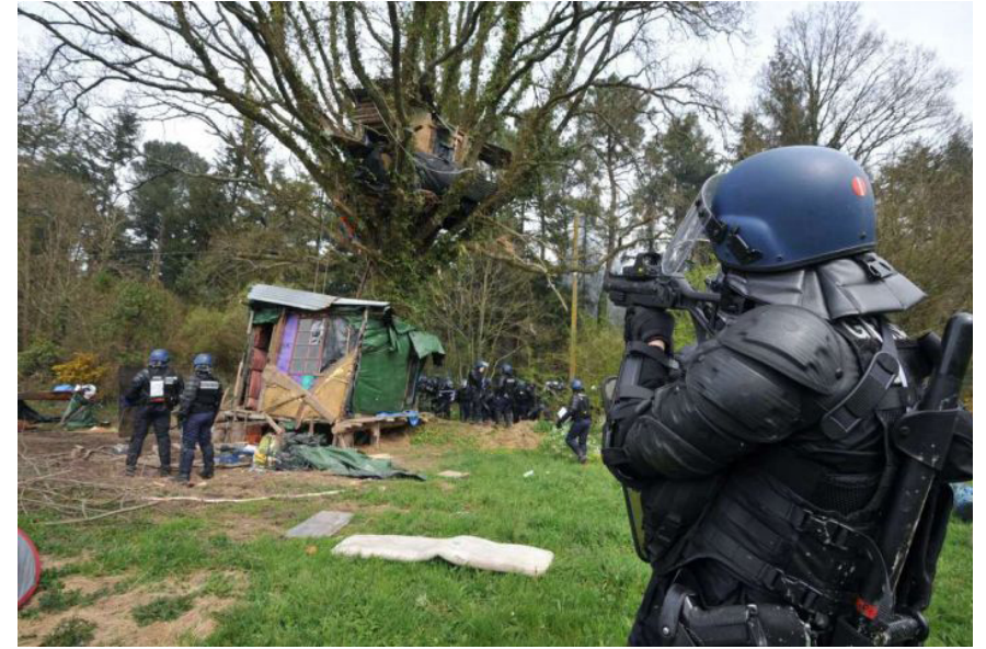
Poliția în La ZAD

din care au lipsit probele incriminatorii, și a unei campanii media împotriva „ecoteroriștilor” 24 , doi dintre aceștia (Baleno și Sole) s-au sinucis în celulele lor (Imperato, 2003: 13; 30). 25 Arestarea lor a coincis cu razii în două squat -uri din Torino. Anarhiștii italieni au declarat că acestea au fost mai mult decât niște sinucideri; au fost asasinate comandate de stat. 26