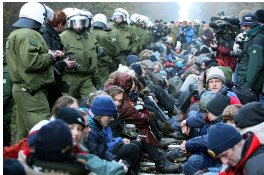
Protestele anti-nucleare Castor din Germania

modele de comportament ” (Aradau and van Munster, 2008: 36). În acest fel, orice poate deveni incriminator: participarea la conferințe și proteste, liste cu cărți, e-mail-uri, fotografii, prieteni, îmbrăcăminte etc.