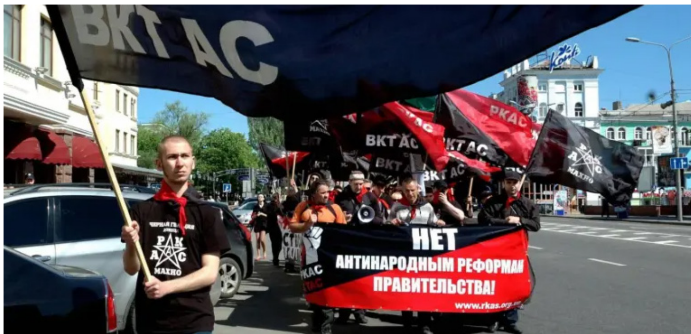
Manifestație RKAS (CRAS).

din regiunile Donețk și Lugansk. În cel mai bun caz, autoritățile au dispărut și au luat distanță față de evenimente. În cel mai rău caz, au condus revolta! Acest lucru este valabil pentru administrația politică, întreaga conducere a poliției, serviciile secrete ale SSU, procuratura și așa mai departe.