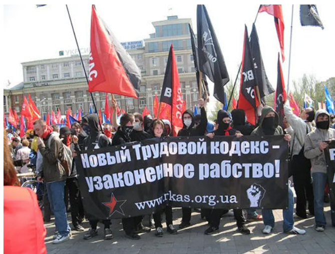
Manifestație RKAS (CRAS) de 1 Mai 2012 în Donețk.

de un an întreg. Prin această lovitură, anarhismul și-a pierdut legătura directă cu muncitorii industriali din Dnipropetrovsk.