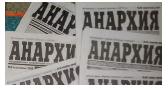
Coperta revistei Anarkia , scoasă de RKAS (CRAS).

În afara CRAS, la sfârșitul anilor 1990, exista un singur grup anarhist ucrainean: grupul de tineret (în principal studenți) „Tigra Nigra” din Kiev. Declarându-se anarho-comunist, acest grup s-a limitat la acțiuni de