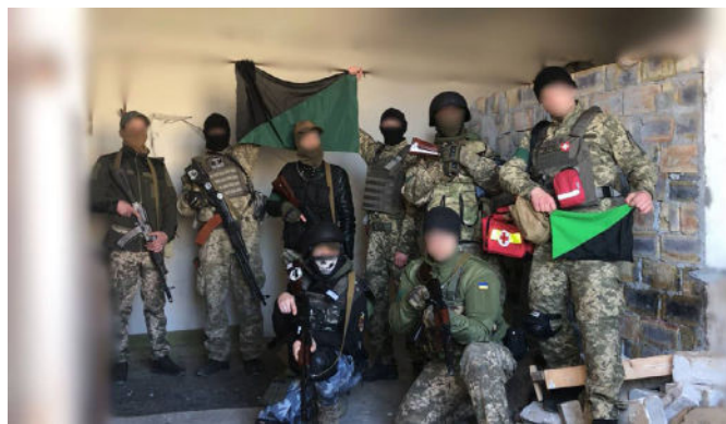
Eco-anarhiști pe frontul din sudul Ucrainei

cu spirit patriotic și unități de partizani, slab echipați și fără experiență de luptă. În cei opt ani de război (2014-2022), această situație s-a schimbat dramatic. A apărut o armată eficientă și bine echipată, foarte motivată și cu o experiență de luptă reală.”