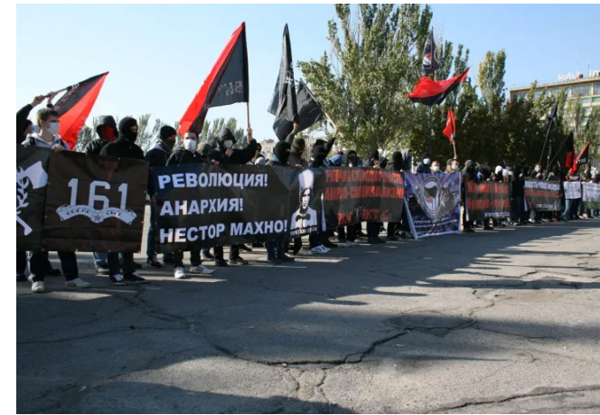
Manifestație RKAS (CRAS) în Zaporozhje.

A.D. și S.Ș.: Nici măcar nu e vorba că majoritatea anarhiștilor și socialiștilor au părăsit Donbasul ocupat (Nu știm ce înțelegeți mai exact prin „stângiști”: cuvântul acoperă o varietate largă de viziuni, unele foarte diferite, de la anarhiști la staliniști de pildă, care nu au nimic în comun...). Dar ideea principală este că în teritoriile ocupate de Rusia nu există decât o singură posibilitate: