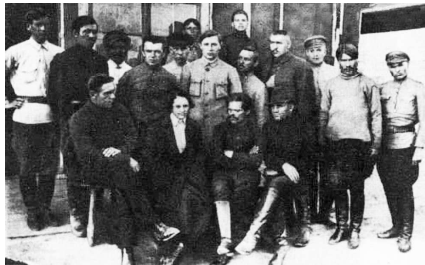
Mahnoviști în România, 1921. În centru, jos: Mahno și Galina Kuzmenko.

la metodele diplomatice. Au trimis la Bălți un grup de agenți CEKA 18 , dar cum Mahno nu se afla acolo, asasinii au fost nevoiți să-și abandoneze misiunea.