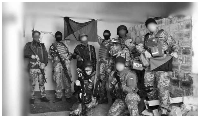
Eco-anarhiști pe frontul din sudul Ucrainei

cu spirit patriotic și unitați de partizani, slab echipați și fără experiență de luptă. În cei opt ani de război (2014-2022), această situație s-a schimbat dramatic. A apărut o armată eficientă și bine echipată, foarte motivată și cu o experiență de luptă reală.”