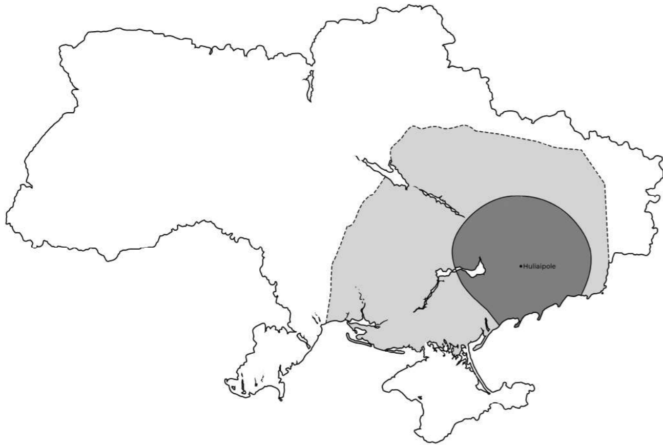
Gri închis: nucleu Mahnovșcinei Gri deschis: alte zone controlate de Armata Insuregntă

în Armata Neagră și Teritoriul liber niște inamici ai puterii sovietelor. Asta și din cauză că, după succesele sale militare, Mahno și-a asumat și rolul de organizator anarhist. La primul Congres al Confederației Nabat a Organizațiilor Anarhiste 12 , Nestor Mahno a fost inițiatorul unei politici în cinci puncte: