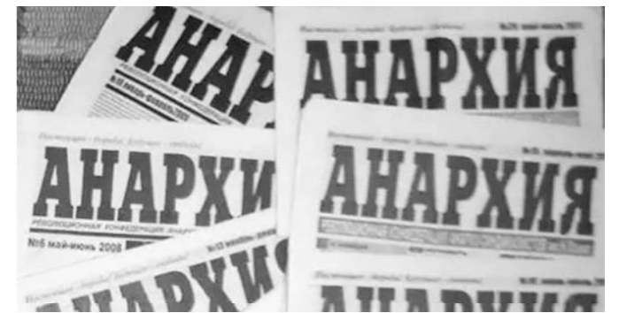
Coperta revistei Anarkia , scoasă de RKAS (CRAS).

În afara CRAS, la sfârșitul anilor 1990, exista un singur grup anarhist ucrainean: grupul de tineret (în principal studenți) „Tigra Nigra” din Kiev. Declarându-se anarho-comunist, acest grup s-a limitat la acțiuni de