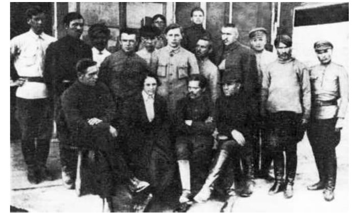
Mahnoviști în România, 1921. În centru, jos: Mahno și Galina Kuzmenko.

În ciuda viitorului sumbru, Mahno nu a renunțat. Chiar dacă trăia sub supravegherea poliției române, el le-a cerut susținătorilor lui să facă rost de arme. În același timp, autoritățile sovietice nu s-au limitat doar la metodele diplomatice. Au trimis la Bălți un grup de agenți CEKA 18 , dar cum Mahno nu se afla acolo, asasinii au fost nevoiți să-și abandoneze misiunea.