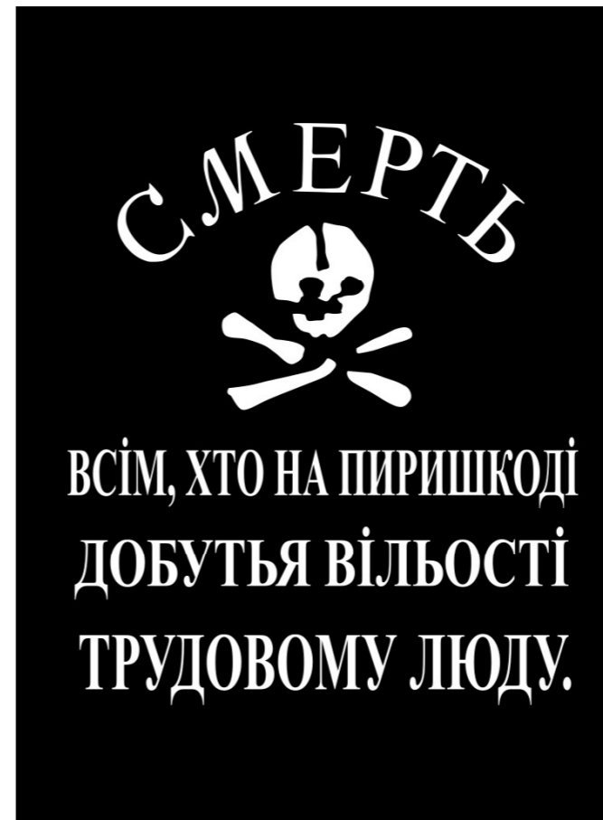
СМЕРТЬ ХТО НА ПИРИШКОДІ ДОБУТЬЯ ВІЛЬНОСТІ ТРУДОВОМУ ЛЮДУ Trad.: „Moarte tuturor acelor care stau în calea libertății oamenilor muncii”

Cu toate acestea, dezvoltarea anarhismului ucrainean nu a fost oprită. În mai multe orașe din Ucraina, anarhiștii au fost implicați în inițiativa de înființare a societății „Memorial”. Pe lângă munca în sindicatele oficiale din propriile întreprinderi, anarho-sindicaliștii au participat la încercările de a înființa o mișcare sindicală independentă. Acesta a fost un punct central al