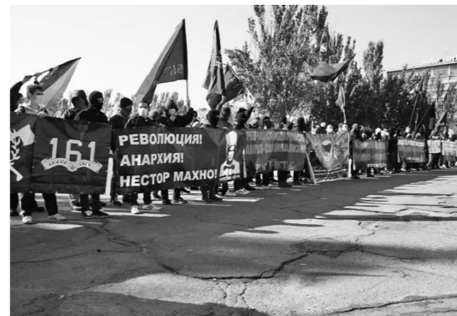
Manifestație RKAS (CRAS) în Zaporojie.

Acest rest de militanți rămași activi și care nu s-au lăsat demoralizați de situație, a început să-și consolideze încetul cu încetul experiența și bazele organizației. Pe lângă buletinul Anarko-sindikalist , în 1995 a fost lansat și periodicul Anarkia , destinat întregii Ucraine, cu un tiraj care a ajuns rapid la mii de exemplare, și ziarul Golos Truda („Agenția de informare a mișcării muncitorești”, o structură creată de CRAS), care a circulat doar în Donețk între 1995-1996. Spre deosebire de toate organizațiile anarhiste preexistente din Ucraina, CRAS avea o structură precisă și aplica o practică de diviziune a muncii în cadrul organizației, rezolvând din interior și chestiunile legate de disciplină. În principiile programatice stabilite erau formulate în mod clar poziții anarho-comuniste revoluționare, lupta de clasă și orientarea spre acțiunea sindicală a muncitorilor. Statutul CRAS