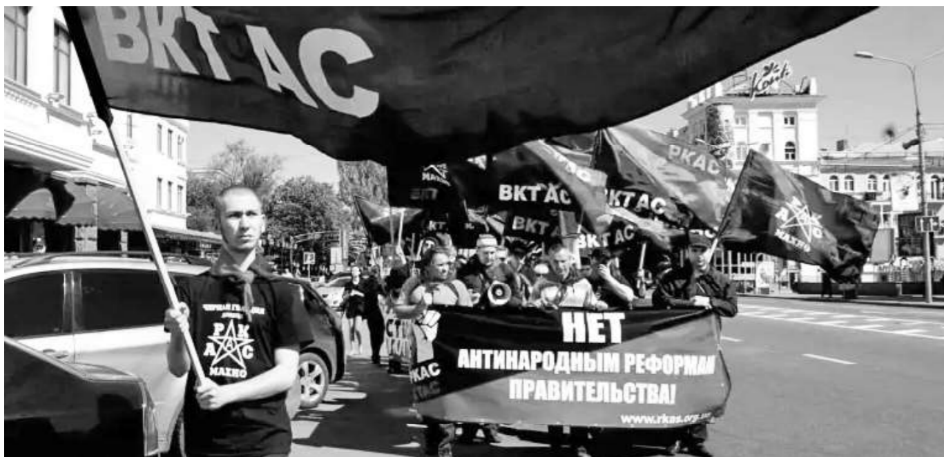
Manifestație RKAS (CRAS).

din regiunile Donețk și Lugansk. În cel mai bun caz, autoritățile au dispărut și au luat distanță față de evenimente. În cel mai rău caz, au condus revolta! Acest lucru este valabil pentru administrația politică, întreaga conducere a poliției, serviciile secrete ale SSU, procuratura și așa mai departe.