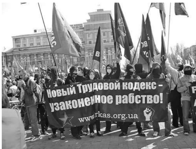
Manifestație RKAS (CRAS) de 1 Mai 2012 în Donețk.

de un an întreg. Prin această lovitură, anarhismul și-a pierdut legătura directă cu muncitorii industriali din Dnipropetrovsk.