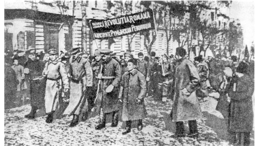
Batalionul revoluționar român din Odesa, 1918.

pierduse aliatul rus, s-au pus de acord asupra unui tratat de pace la 9 decembrie 1917, la Focșani.