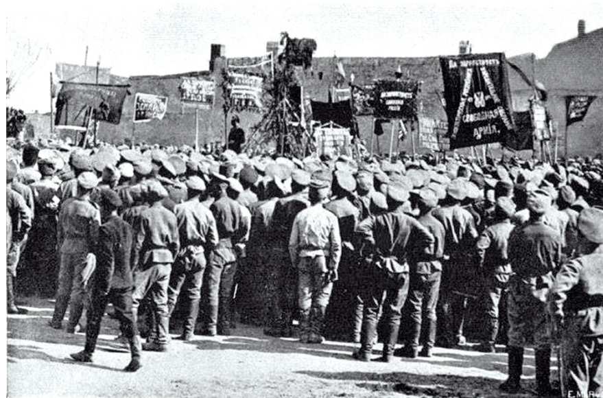
Demonstrație pentru pace a soldaților ruși din Bacău, mai 1917.