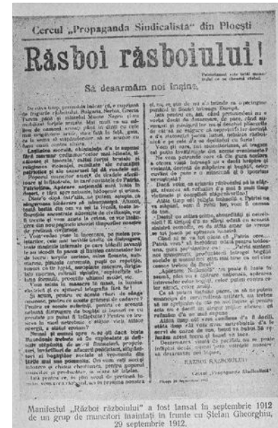
Manifestul „Război războiului” (1912)

Europa de sud-est și Balcanii au fost periodic devastate de războaie. Interesele geopolitice ale guvernelor, adeseori camuflaate în discursuri naționaliste, erau impuse prin forță armată. În timpul Primului Război Balcanic (septembrie 1912–mai 1913), care a distrus influența Imperiului Otoman în regiune și din care câștigătoare au ieșit Bulgaria și Grecia, România a avut o atitudine ezitantă și neutră, chiar dacă în interiorul țării presa, majoritar naționalistă, susținuse intrarea în război. România a renunțat la această atitudine odată cu izbucnirea celui de-al Doilea Război Balcanic (iunie 1913–iulie 1913). Bulgaria, care nu se mulțumise cu teritoriile dobândite în urma