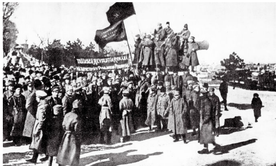
Batalionul revoluționar român din Odesa, 1918.

anterior, guvernul român a considerat că sosise momentul oportun ca să anexeze Transilvania, asupra căreia avea pretenții. În aprilie, România a declarat „războiul de eliberare” sau „războiul pentru reîntregirea neamului” (deși Transilvania nu făcuse parte vreodată din statul român). Unitățile armatei române au ocupat din nou Transilvania.